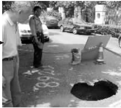
第三次 | 大前天,路面又塌陷了

快报讯(记者 付瑞利)去年,快报曾两次报道鼓楼区宝地园小区路面发生塌陷。5月5日傍晚6点多,宝地园3栋楼与4栋楼之间的水泥路西端又塌出个窟窿。这一次道路是在没有任何外力压迫的情况下突然塌陷。路面塌陷的面积不到两平方米,半人深,位置正好在一处