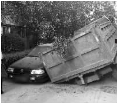
第一次 | 2011年3月27日,一辆卡车与一旁轿车被陷