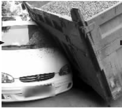
第二次 | 2011年5月4日,卡车被陷后压坏一辆轿车