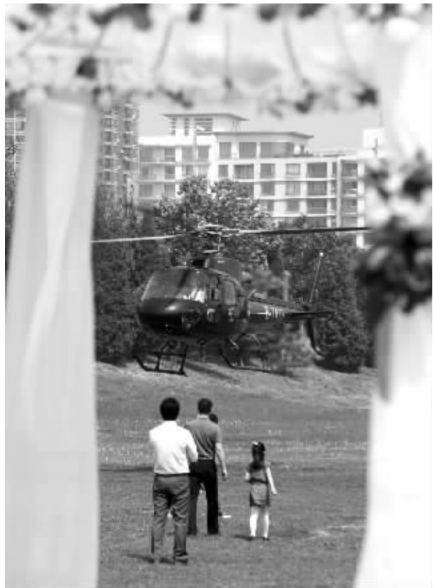
北京朝阳区一公馆,直升机降落,宾客们纷纷上前迎接新人

伴随着巨大的轰鸣声,一架直升机降落在草地上,顿时吹起漫天的蒲公英。随后,在众亲友的祝福中,一对新人走下该机。前日上午,北京首次直升机迎亲在东四环某公馆内上演,为这一新兴的航空业务拉开序幕。据了解,这次飞行花费5万元,由专业航空公司提供服务。