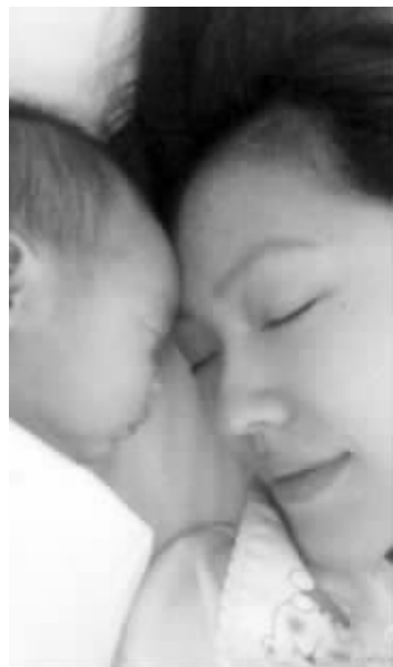
有女万事足