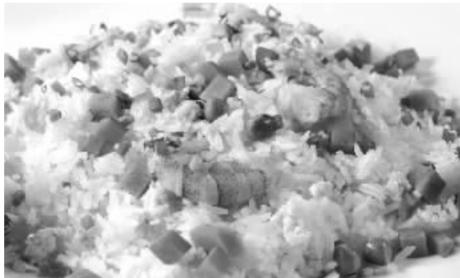
扬州炒饭如今名扬天下