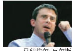
马纽埃尔·瓦尔萨斯