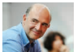
皮埃尔·莫斯科维奇

在社会党党内是一位倍受争议的人物。他是罗马尼亚裔移民,10岁时来到法国,在反对歧视、提倡社会多元化等议题上立场激进,曾任社会党社会平等问题秘书长。在初选中负责协调奥朗德和媒体的关系,是竞选团队中象征多元化的面孔。