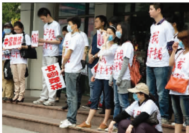
5月4日,业主聚集在杭州中豪集团门前,要求赔偿差价

该校教务处长证实,这是对该校自习室管理模式的一种“试验”,旨在解决自习难题。之后,校方又称政策还未正式出台,目前报名只是“预演”,已收的“买位费”将退还。据《半岛都市报》