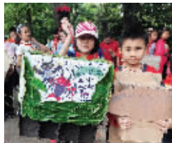
三条巷小学的同学们为蝙蝠制作了巢箱