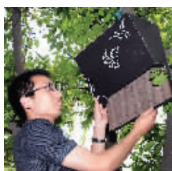
工作人员把巢箱挂上树