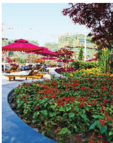
社区景观大气雍容