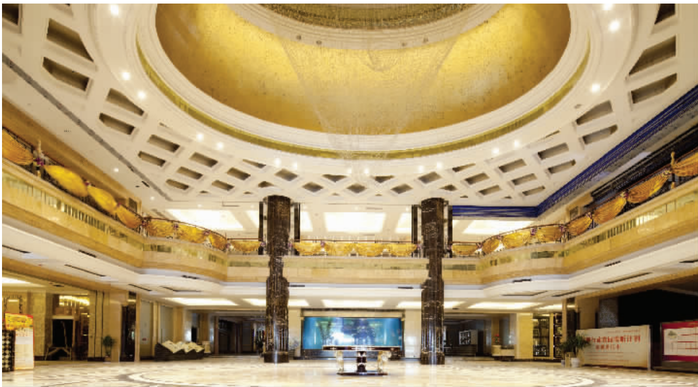
建设中的凤凰城已经展现出超级大盘的峥嵘气象