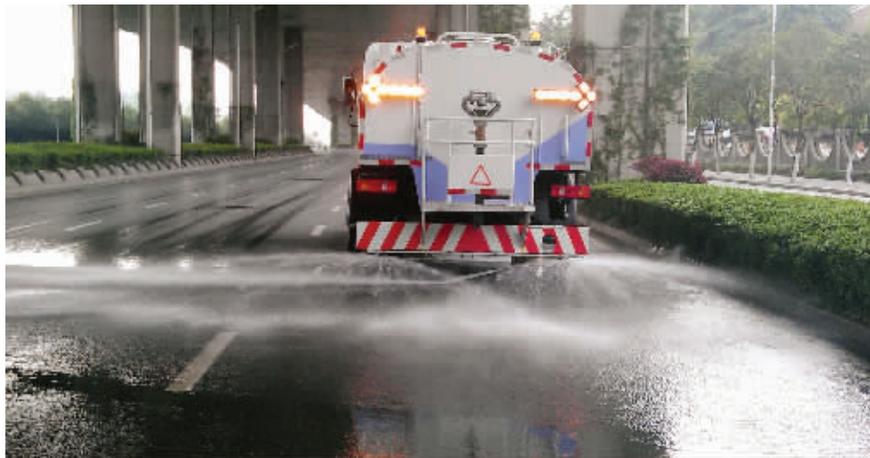
看到洒水车，不少车主会跟在后面以免被淋