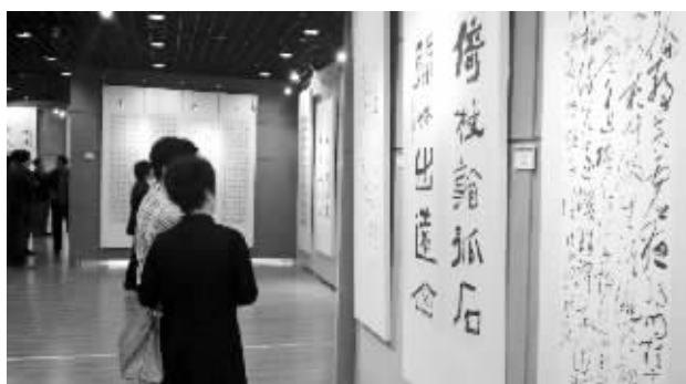
书法大家的作品吸引了很多宜兴市民驻足观看