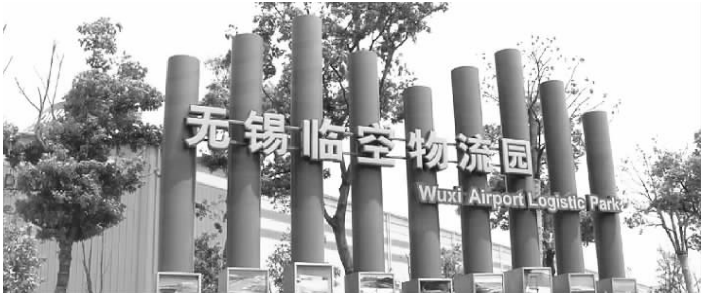
空港建成全国首个临空物流服务业标准化试点 资料图片