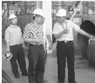
检查企业安全生产