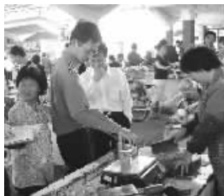
免费检定农贸市场电子秤