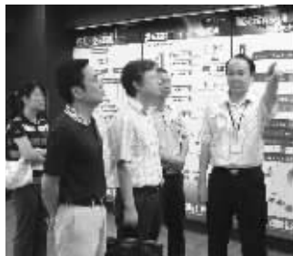
上门为清华紫光服务

保证体系,规范企业经营管理活动;积极推动企业开展质量管理体系认证及引导企业实施卓越绩效管理,按照国家及国际先进管理体系组织经营等。通过一系列的帮助扶持措施,企业的各项基础性工作取得了明显的进展。目前,新区共有3个中国名牌产品,28个省级名牌产品,2家省质量奖企业,86个市级名牌产品,9家市质量奖企业。省级名牌中,现代服务业名牌4个,总量为无锡市各县(市、区)首位;名牌聚集已成为无锡新区工业经济快速发展的突出亮点,有力地推动了地方经济发展。