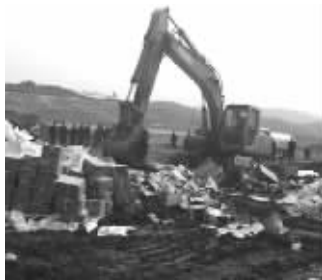
销毁假冒伪劣产品