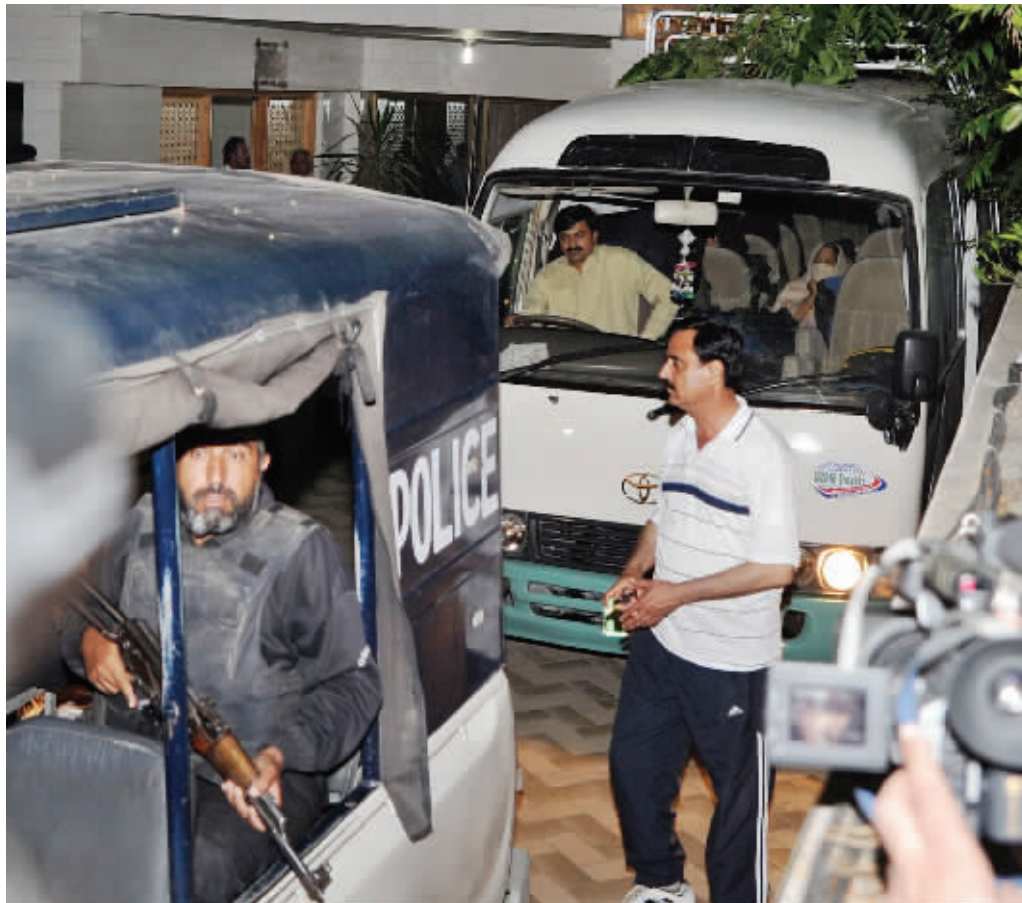
4月26日,巴基斯坦警察护送本·拉丹家人乘坐的汽车