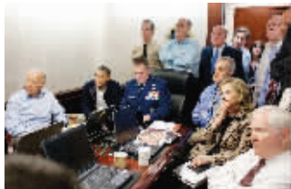
美国总统奥巴马、时任国防部长盖茨等官员观看卫星实时传回的突袭视频画面