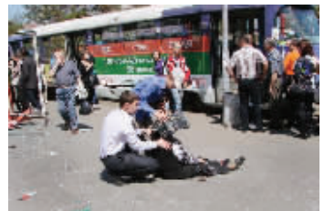
两名男子在帮助伤者