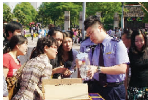
无锡工商局工作人员在向市民传授识别假冒侵权商品的知识 资料图片