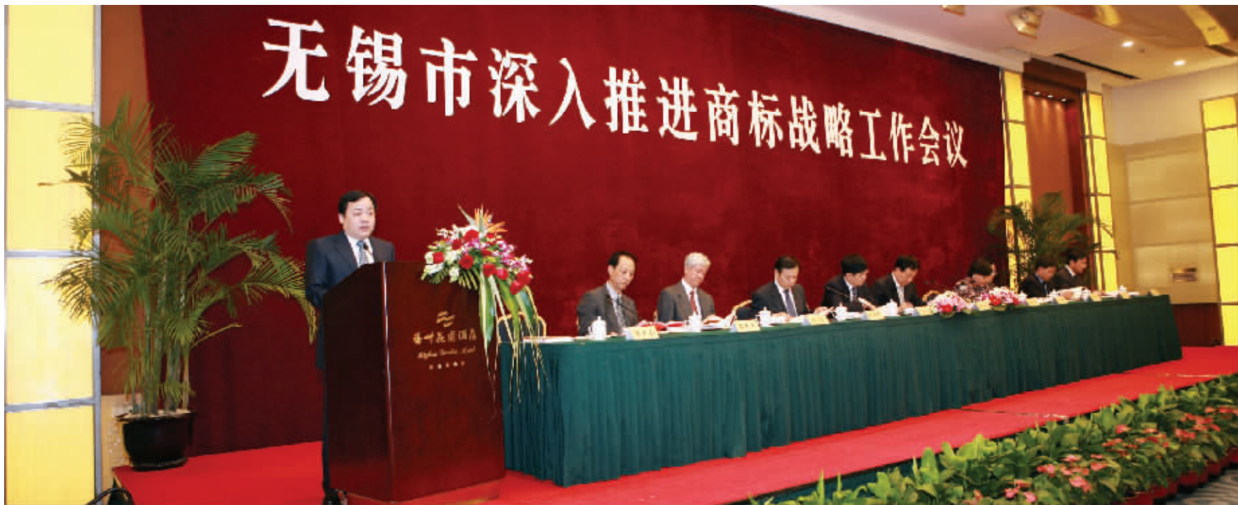
无锡工商局蒋亚亭局长在无锡市深入推进商标战略工作会议上作工作报告