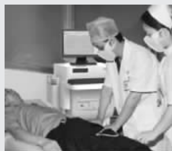
金陵中西医结合(原金陵男科)医院医护人员为患者实施前列腺治疗手术

金陵中西医结合(原金陵男科)医院男科主任,从事男性生殖健康30余年,擅长运用国际国内先进的医疗技术和设备科学诊断治疗各种性传播疾病,对急性慢性前列腺炎、男性性功能障碍等疾病的治疗具有深厚造诣。