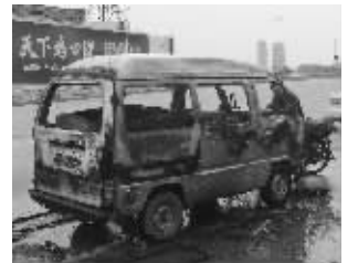
自燃的面包车

@记者 孙玉春:昨天下午3点半,一辆满载冷饮和全新冰柜的送货面包车,行驶到雨花南路靠近纬八路高架时发生自燃,风力助涨了火势,短短几分钟火苗便蹿至全车,一时浓烟滚滚高达十余米。面包车内堆了数十箱各种冰淇淋、雪糕等,很多外包装烧糊,车主表示将全部丢弃。司机说,车子加上货物损失在万元左右。事故原因初步判定为电线短路引发油管自燃。 (汤先生线索费50元)