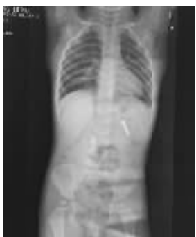
铁钉长约2厘米