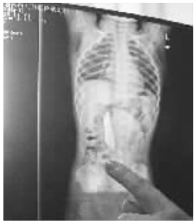
指甲剪长约5厘米