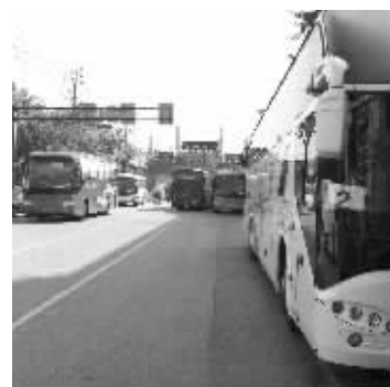
箍桶巷违停的大客车

近日,有市民向快报反映,每到周末和节假日,秦淮区箍桶巷和马路街附近的道路上,都停满了旅游大巴,影响附近居民的出行。