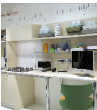
意大利威乃达:办公、厨房合二为一