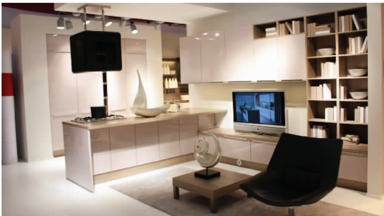
德国柏丽Nobilia:书架、沙发融入开放式厨房空间,组合成一个惬意OPEN的客厅

经过4月18日一整天的观摩,现代快报记者不得不由衷感叹,第51届米兰国际家具展的主会场——米兰国际会展中心真是一个“大家伙”。整个中心上下两层共22个巨大展馆,通过这些窗口,众多顶级品牌向来自全球各地的经销商、设计师和相关人士展示着自己的风采。 □现代快报记者 林治尧 发自米兰