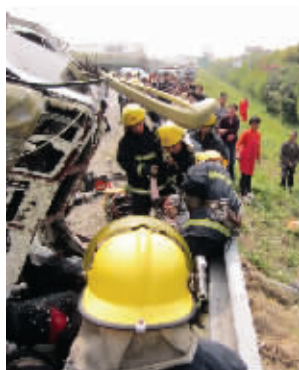
现场救援紧张进行

昨天中午12时许, 记者赶到事发发现时, 事故车辆已被拖离, 但四周依然一片狼藉。记者看到, 事发处距离沿江高速常熟出口8公里左右, 高速当中的隔离防护栏被撞毁二十多米。路边