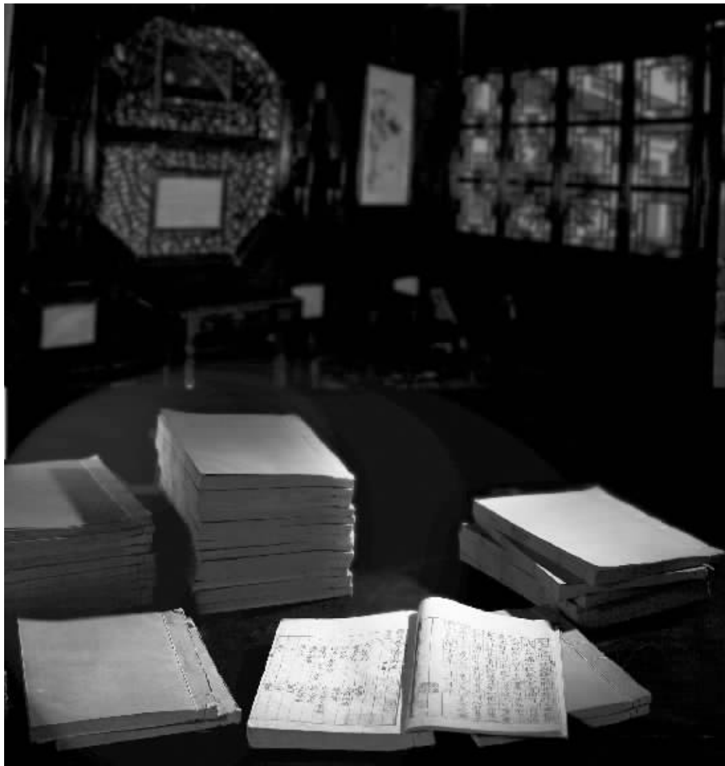
过云楼藏书之《锦绣万花谷》