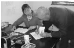
胡埭镇给老年农民发放养老补贴

高度关注安置房建设及审核办证、安置小区物业管理、消防等一系列事关百姓切身利益的问题,通过多方调研督促相关部门。2012年1月16日,困扰滨湖区多年的国土拆迁安置房两证办理的政策性难题终于得到解决,滨湖区开出全市首张国土拆迁安置房房产证。安置小区的物业管理、消防设施建设逐步改善。