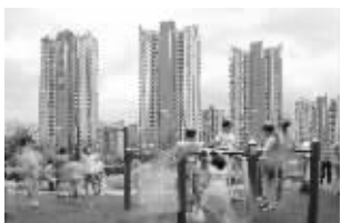
我们的家园