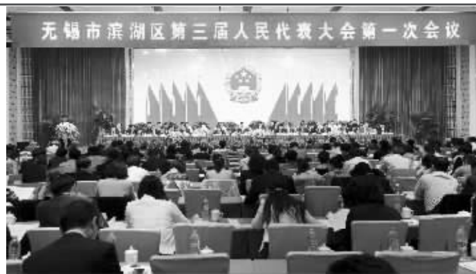
滨湖区举行第三届人民代表大会第一次会议 资料图片

当前,滨湖区已步入老龄化社区,该区60岁以上老人已达9.65万人,老龄化率达21.03%。滨湖区人大常委会高度关注并