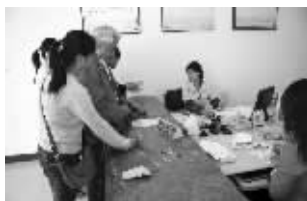
办理失地农民保障相关手续