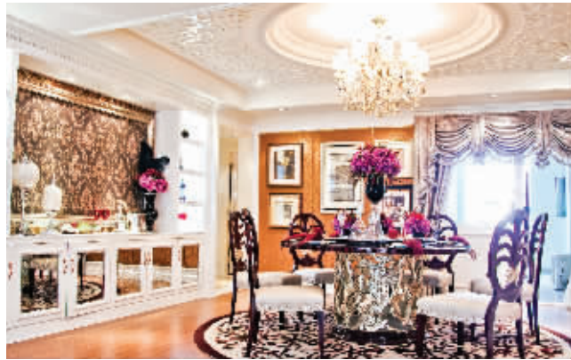
凤凰城,是万千业主五星级的家