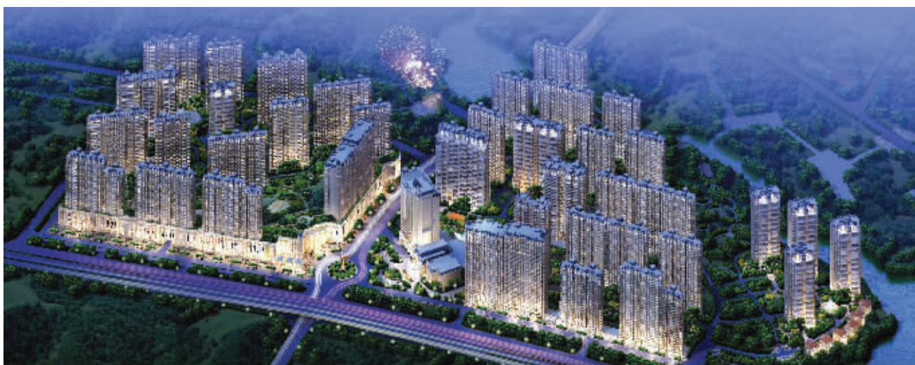
南京凤凰城鸟瞰图

如今,增城已经发展成为连接广州、深圳、东莞等重要城市的区域枢纽,带动了区域经济的融合与发展。更有评论称:如果没有碧桂园开发的凤凰城,就没有后来的新增城。的确,凤凰城的落户和发展带来了大量的就业机会和巨大的发展商机,继广州凤凰城之后,本田汽车、五羊摩托车、福耀玻璃等一批重大项目落户增城。