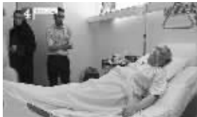
迈格拉希在医院接受治疗

据英国《每日邮报》报道，身患绝症的洛克比空难制造者阿卜杜勒·迈格拉希已于16日从医院回到家中。他家人称，迈格拉希已无康复可能。