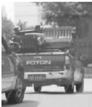
用公车帮人搬家被网友曝光

4月5日中午,武进区城管局一辆车子被拍到公车私用帮人搬家并被发到网上。昨天,记者从武进区城管局环卫处获悉,4月13日,这名公车私用的环卫处工作人员被要求补缴车辆使用费、油费外还被罚款一千元。而随着这张罚单被公布到网上,一些网友表示,武进城管采取这种经济处罚的做法值得其他部门借鉴。