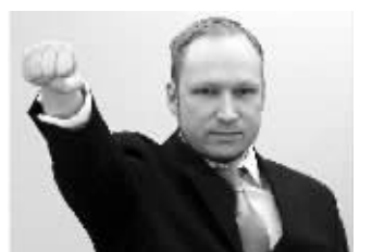
布雷维克在法庭摆出极右翼手势