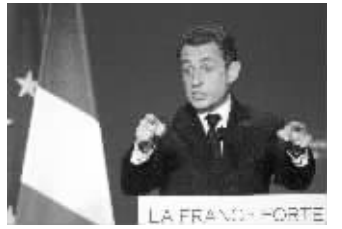
萨科齐在一次竞选活动中讲话

电视画面中,萨科齐面对一个大显示屏中的奥巴马。两人互致问候后,奥巴马说:“这会儿你一定很忙,我很赞赏你正在发起的(竞选)攻势。”萨科齐笑着回答:“我们会赢的,奥巴马先生,你和我,都会赢。”