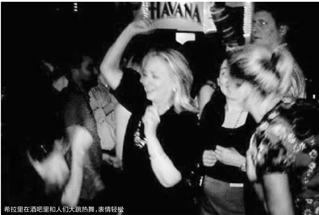
希拉里在酒吧里和人们大跳热舞,表情轻松