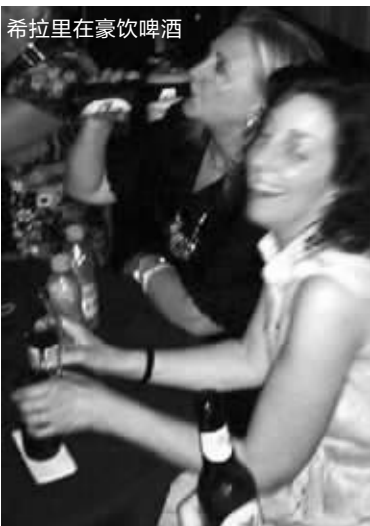
希拉里在豪饮啤酒