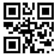
草莓派电子杂志下载