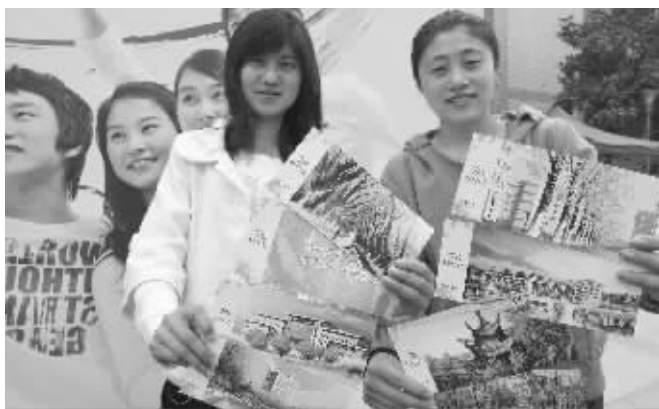
大学生展示南邮手绘明信片

这七处景点是如何筛选出来的?南京邮电大学党委宣传部部长许公全介绍,去年,南邮在网上启动了校园七景的评选,最终从几千张图片中选出了三牌楼和仙林两个校区7张投票率最高的图片。随后,南京邮政局与南京邮电大学又邀请了上海的设计人员进行手绘,“这位设计师曾经给好莱坞画过动画,为了体现光影的效果,先后修改了十多稿,修改过程中,也曾在学生中征集过意见。”许公全说,明信片是校庆纪念品中发放面积最广的,学校将向所有校友和在校学生发放2.8万套明信片册。此外,南京市邮政局还精心设计了一枚首发的纪念戳。