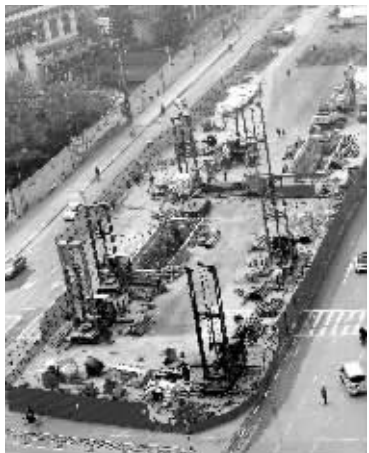
水西门隧道开挖前准备工作正在进行

周建良介绍,目前进行的是隧道开挖前的工作,主要任务就是进行管线迁移和为隧道开挖埋设支护桩。根据规划,水西门隧道将下穿建邺路、水西门大街,长1280米,采用明挖方式进行开挖。水西门桥路面下方管线相对复杂,路面下方有一条正在使用的大型污水管道,涉及面广而且埋藏较深,需要妥善处理。