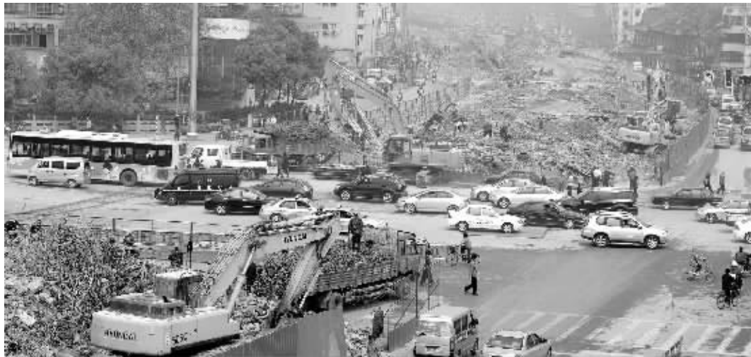
城西干道汉中门路口东西向交通已恢复