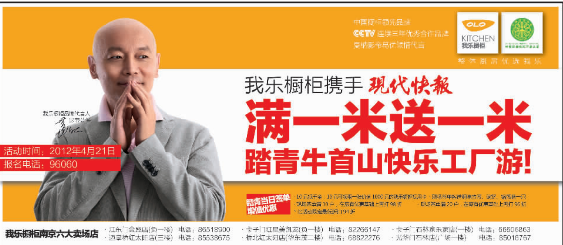
制图 李荣荣