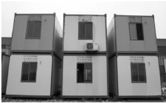
图为网络曝光的南通街头集装箱“廉租房”外部和室内

一样针对特殊人群?记者从出租该集装箱“廉租房”的联系人处获悉,该“廉租房”位于南通市通州区张芝山镇336省道附近。赶赴现场后现代快报记者发现,这些集装箱“廉租房”所在的位置并不是一个居住小区,而是一个专门生产住人移动房的工厂,厂里的工人正在里里外外忙碌着对材料进行切割组合焊接。