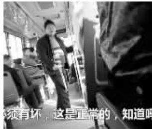
“甘蔗哥”公交车上舌战乘客

日前,在无锡的一趟公交车上,一名啃甘蔗的乘客,因乱吐甘蔗渣,引发了全车乘客的众怒,该名男子随后还与一车人展开唇枪舌战。最后有乘客将当时的一幕拍摄下来,上传至网站,结果短短22个小时就有46万人次点击观看。