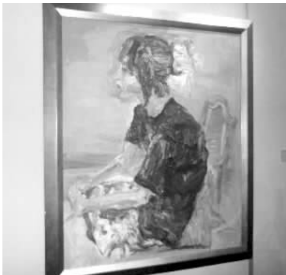
画展上的画

“感觉这些老师就像参加高考一样,他们不仅能拿足基本分,而且还在创意上拥有加分。”一位特意到现场打探的初三学生家长说。宁海中学校长郭其俊表示,宁海中学连年的美术统考省状元,以及众多学生考上清华、国美等名校,都离不开这些才华出众又特别热爱教师职业的画家老师们的引领。“前年,有位老师的一幅油画就被拍出过36万元的高价,但他仍然坚持在教学岗位上,这在我们学校并不是个别现象。”今天,有兴趣的市民仍可来南京美术馆观展。