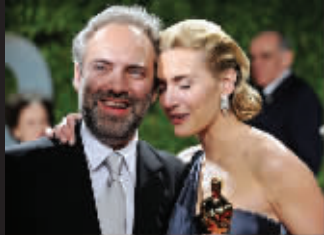
温丝莱特和前夫山姆·门德斯