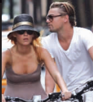
莱昂纳多和“绯闻女孩”布莱克