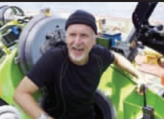
58岁的导演卡梅隆挑战深海