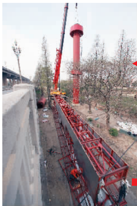
巨幅广告牌被分割拆除落地