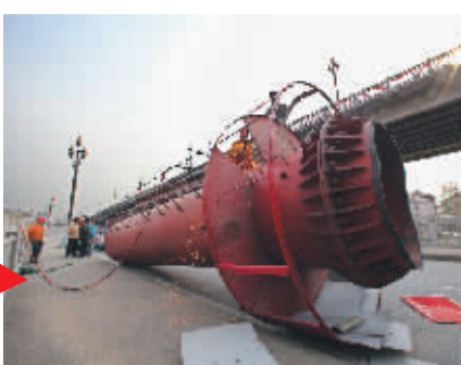
工人正在拆解巨幅广告牌上部被切割的立柱

长江大桥两侧的高立柱广告牌一直是游客大桥风景照中的“顽固背景”。昨天长江大桥南堡下关段周边最后一块广告牌也安然落地,意味着下关大桥周边14块户外违规广告牌全部拆除。近期,大桥北桥头堡浦口段也将拆除最后两块广告牌,届时,长江大桥周边再无“高炮”。