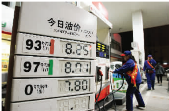
今天零时,新价格表出炉