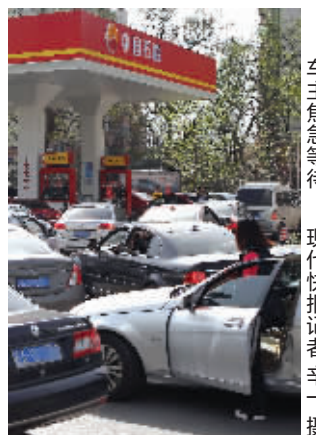
车主焦急等待