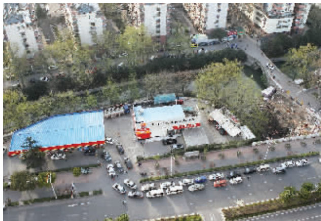
昨天到龙蟠中路加油的车排成之形