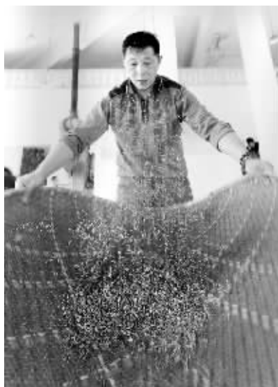
炒茶师傅在清除残碎叶