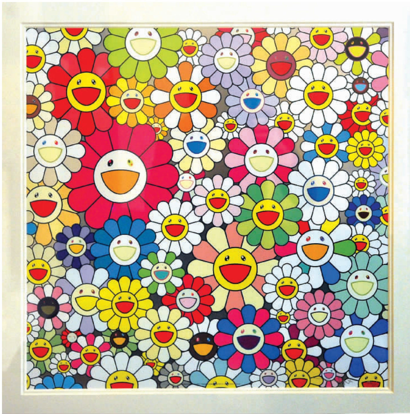
flowers from the village of Ponkotan