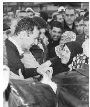
3月27日,叙利亚总统巴沙尔·阿萨德(左)在霍姆斯市和支持者交流