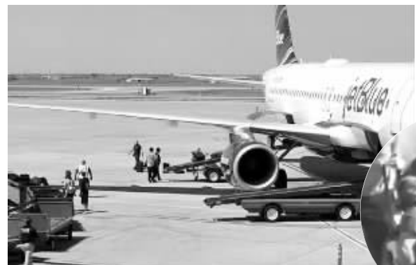
客机转至阿马里洛紧急降落,右图为执法人员在客机安全降落后控制了机长

美国捷蓝航空公司说,一架原定27日飞往拉斯韦加斯的客机因机长精神失控紧急降落得克萨斯州阿马里洛一座机场。