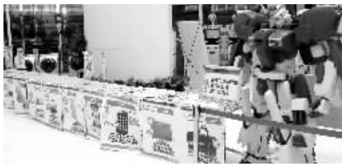
乐购仕百日庆典多款会员超特价商品,还有高达机器人迎接你哦~