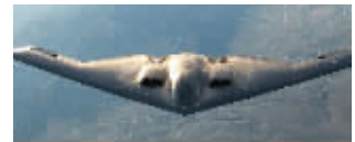
B2隐形轰炸机 资料图片