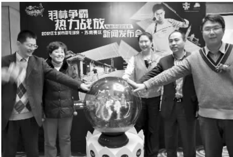
主办单位有关负责人与世界冠军卢兰一起按下启动器,宣布2012“羽林争霸”苏南赛区比赛正式启动