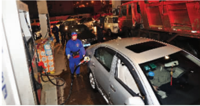
昨晚,南京赛虹桥加油站,加油的汽车排起长队