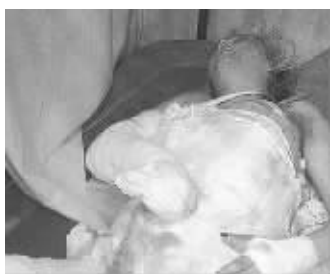
马卡尔被焚烧前后

据外媒3月18日报道，乌克兰两名前高官的儿子日前涉嫌轮奸一名少女，并将其丢弃在建筑工地的深坑内浇上汽油焚烧。然而这两名恶少却因“证据不足”被释放，此事遂引发乌克兰全国范围内的抗议活动。