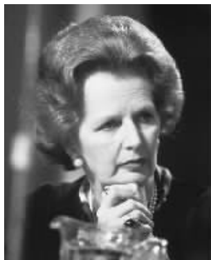
任首相时的撒切尔