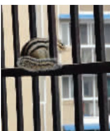
爬上阳台,感悟鼠生