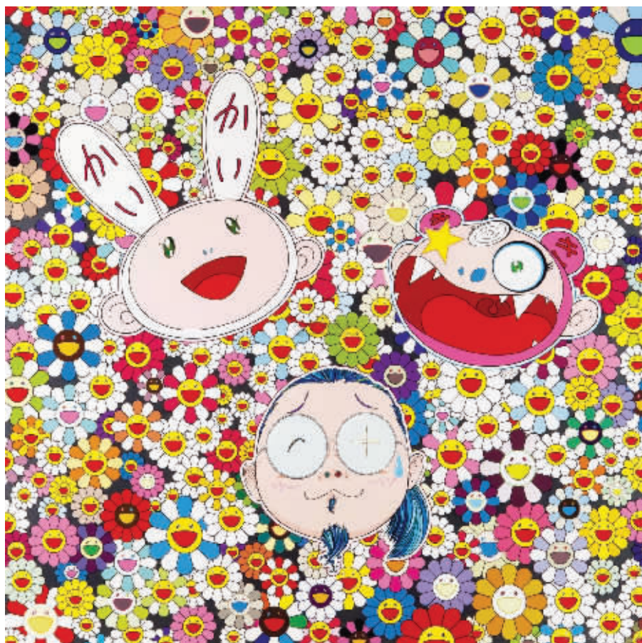
《Kaka Kiki & Me》