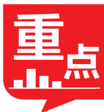
“限炒”新规出台后,上市的新股首日表现一览