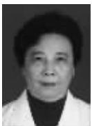
朱佩英 主任医师、教授

1955年毕业于上海第一医学院。曾任上海市第六人民医院妇产科主任,长期从事妇产科医学的医教研工作,对围产医学及卵巢恶性肿瘤研究成就突出。曾担任中华医学会妇产科学会副主任委员,中华妇产科杂志常务编委等职,擅长妇科恶性肿瘤,子宫内膜异位,不孕症,妇科急诊诊断和处理;妇科疑难病症处理等。