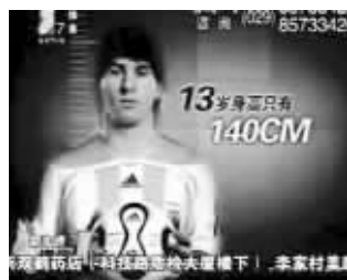
增高产品广告山寨了梅西

提到企业与明星之间剪不断理还乱的关系,相信很多人第一反应会是,最近炒得火热的美国篮球巨星“飞人”乔丹起诉中国乔