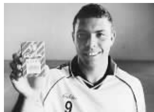
罗纳尔多与金嗓子广告

丹体育公司。乔丹说,“当有人利用或者冒用这个名字时,我就得保护它。这对谁都是如此,在全世界,名字就是你的DNA,当有人使用时就是侵权。”2月23日,淡出球坛多年的一代篮球巨星迈克尔·乔丹主动向乔丹体育下战书。“我必须行动起来,维护自己对名字和品牌的所有权。”