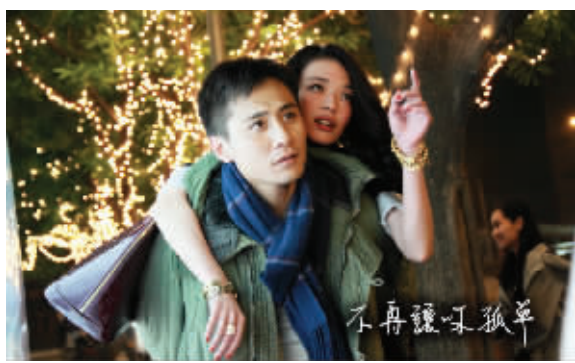
生意,内地观众能信吗?刘烨卖了祖房给舒淇筹钱做