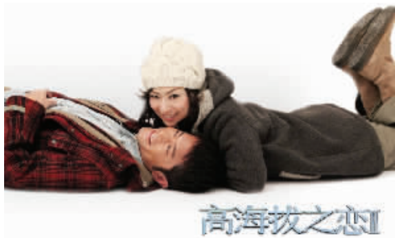
的新娘,内地观众能信吗?王宝强在婚礼上抢走古天乐