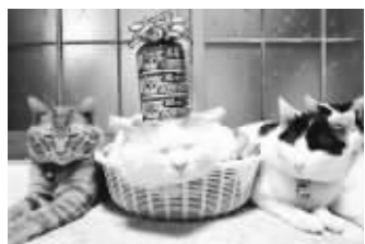
主人送三盒猫粮为其庆生

“猫叔”是一只2002年3月8日生于日本岩手县的猫,脑袋奇大、表情憨厚、喜欢头顶重物“卖萌”,