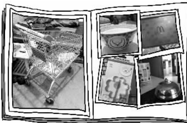
因为高调晒赃物,“大懒糖”被网友封为“顺神”

近日,在豆瓣网一个名为“为我顺的东西开个相册”的相册里,网友“大懒糖”展示了自己从超市、饭店、商场顺手牵羊的“战利品”。仅两天时间,该相册的点击量已近万。网上也出现大量粉丝,膜拜这种“顺”物行为。快报记者就此事对“大懒糖”进行了深入采访,他向记者陈述了整件事情的来龙去脉并袒露了自己的心路历程。