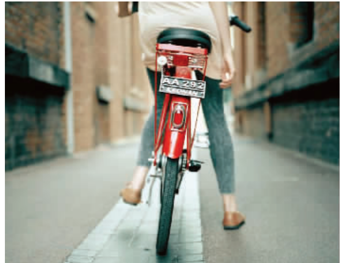
如果你失踪了,那个时刻都为你揪心的人便是你最亲的人(资料图片)

“姐,你怎么回事?电话一直打不通,快把妈急死了,就差买张车票,跑到你那里去了,赶紧给妈回个电话。”挂了弟弟的电话,妹