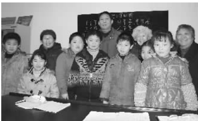
辅导站的老师和孩子们

班主任有了,语文老师有了,数学老师也有了……如果再有一位英语老师,南湖街道文体社区课外辅导站的孩子们,就能享受到更全面更全面的免费服务了。谁有这份爱心,能来帮帮他们呢?