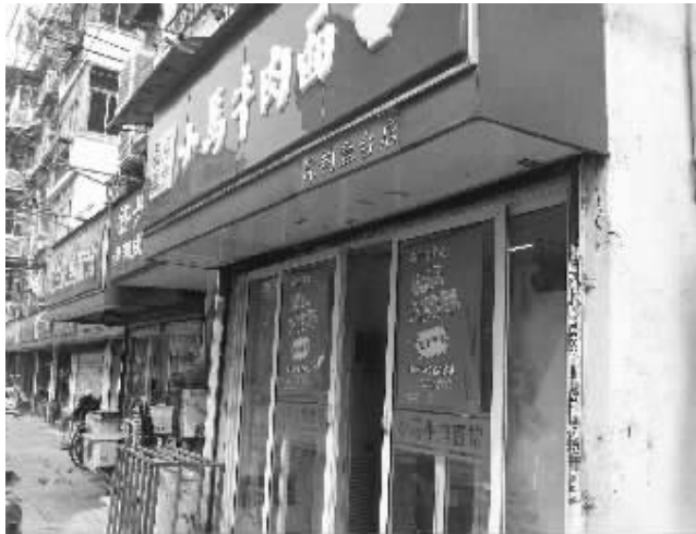
小面馆推出爱心活动

秦淮区马道街有个不起眼的小面馆,店主是一对下岗再就业夫妻,他们白手起家,吃苦耐劳,生意日趋红火。前天是面馆开业8周年的日子,夫妻俩推出别出心裁的店庆方式,一个月内,对80岁以上顾客,免费供应一碗面,每天供应20碗。“乖乖,一碗牛肉面9元,20碗就是180元,一个月就要5400元,老板真爽气。”大家交口称赞,“店主夫妻弘扬孝心,是个大好人。”