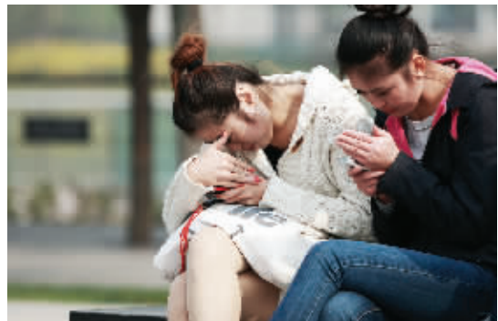
晃眼 在广场闲坐的美女玩手机,被阳光刺得看不清手机屏了。(作者黄家双获30元话费)