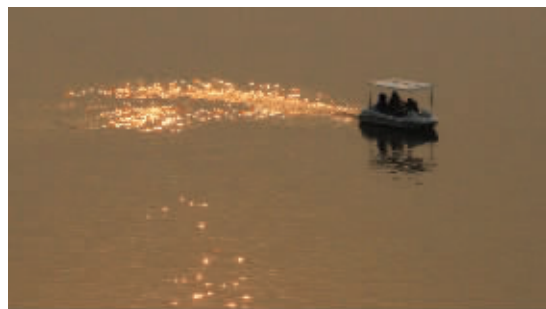
喷火 夕阳下,湖中央游弋着一条“喷火船”。3月10日摄于莫愁湖 (作者徐志辉获30元话费)

也许是等待得太久,也许是风雨搅动了思绪,人们沐浴在久违的阳光下,尽情地释放。“气象先生”说,这轮阴雨天仅仅画上逗号,而非句号。可谁会不在乎呢,所有烦闷与惆怅早已抛在了草坪上、湖水里、人们的身后。