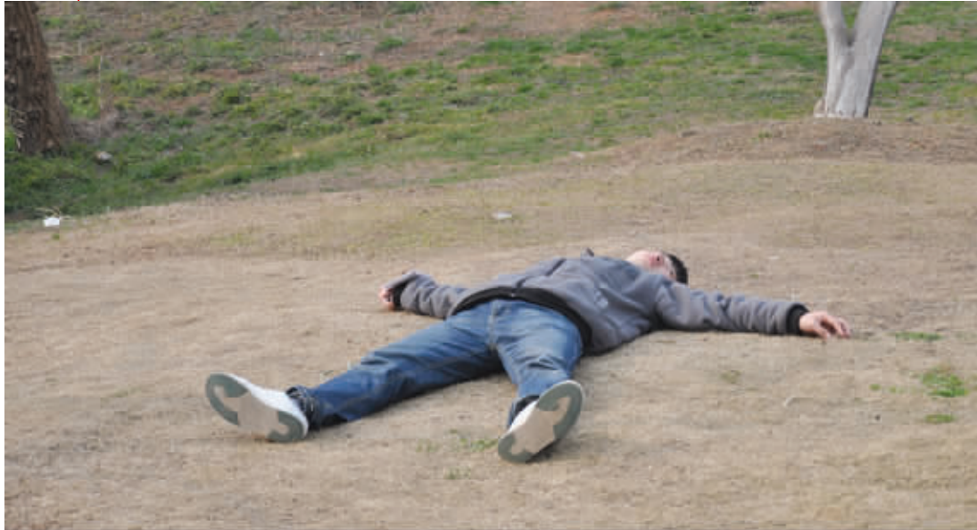
让我一次晒个够 摆成“大”字,让温暖的阳光洒遍全身。3月10日摄于古林公园 (作者剑先生获30元话费)