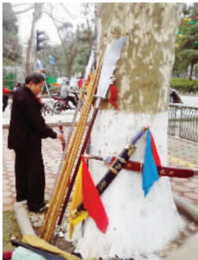
高手“获释” 刀、枪、剑、棍,十八般武艺样样精通,可老天不给面子,无法施展。这回,得好好出去耍耍。摄于台城 (作者清溪阁主获30元话费)