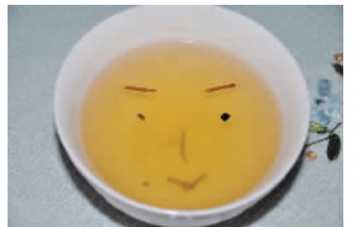
惊喜发现 饭后,倒了半碗茶水,无意中发现漂浮的茶叶(棒)组成了一个脸谱。3月9日摄于锁金二村家中 (作者陈菊华获30元话费)